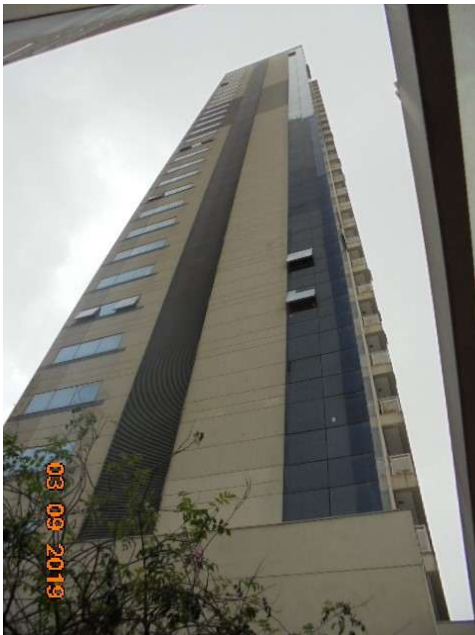
FOTO Nr.02: Panorama do Ed. Santorini onde se situa o escritório avaliando.