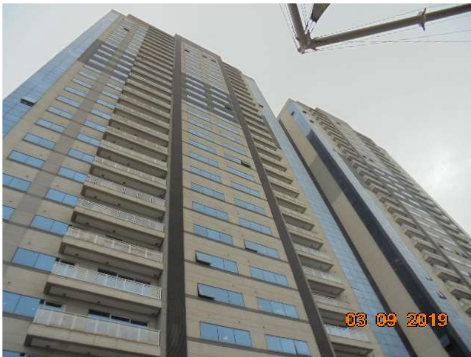
FOTO Nr.03: Panorama do Ed. Mykonos e ao lado o Ed. Santorini onde se situa o escritório avaliando e seus acabamentos externos.