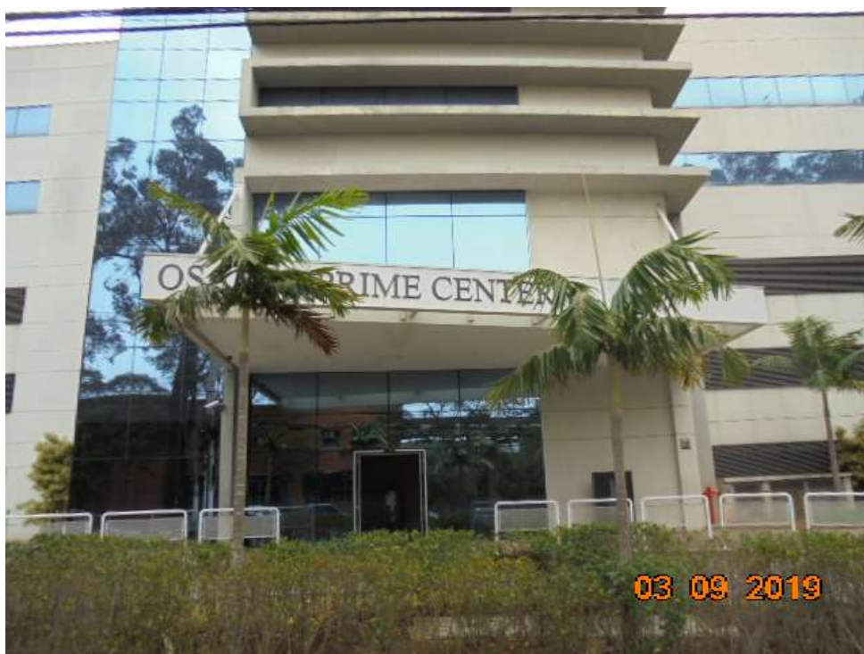
FOTO Nr.05: Detalhe da entrada do empreendimento pela Av. Franz Voegeli.