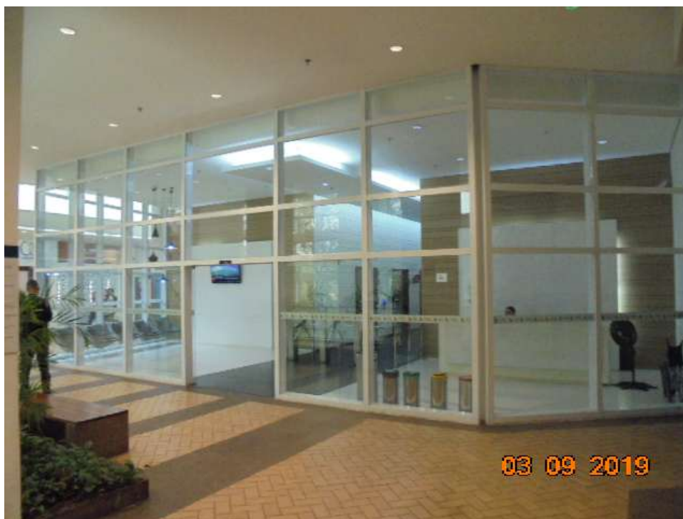
FOTO Nr.08: Vista interna da portaria do Ed. Santorini, situada no pavimento térreo.