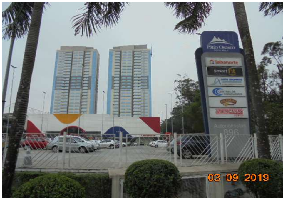
FOTO Nr.15: Vista dos dois edifícios do condomínio a partir da entrada do Shopping Open Mall.