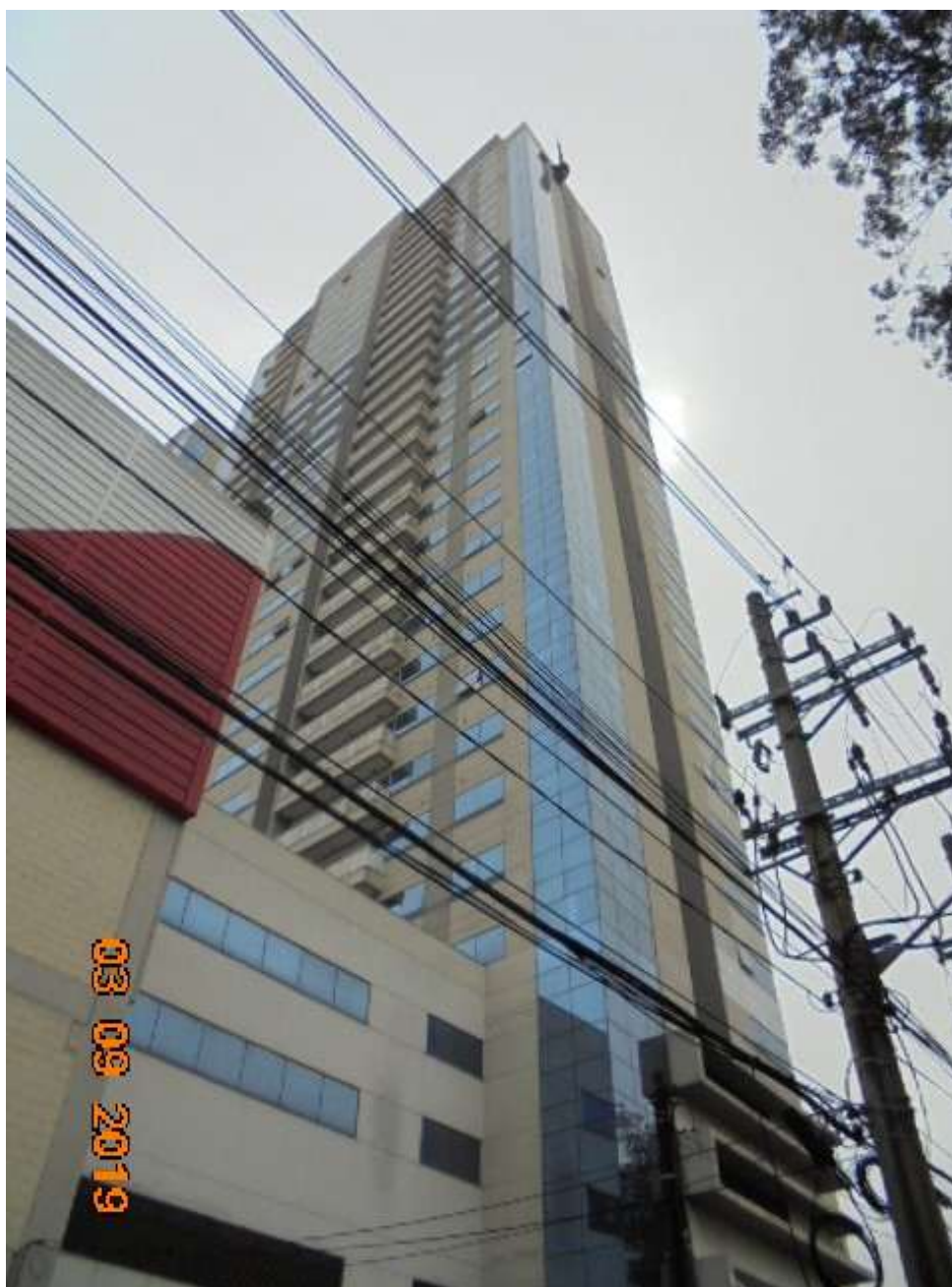
FOTO Nr.01: Panorama do Ed. Santorini onde se situa o escritório avaliando.