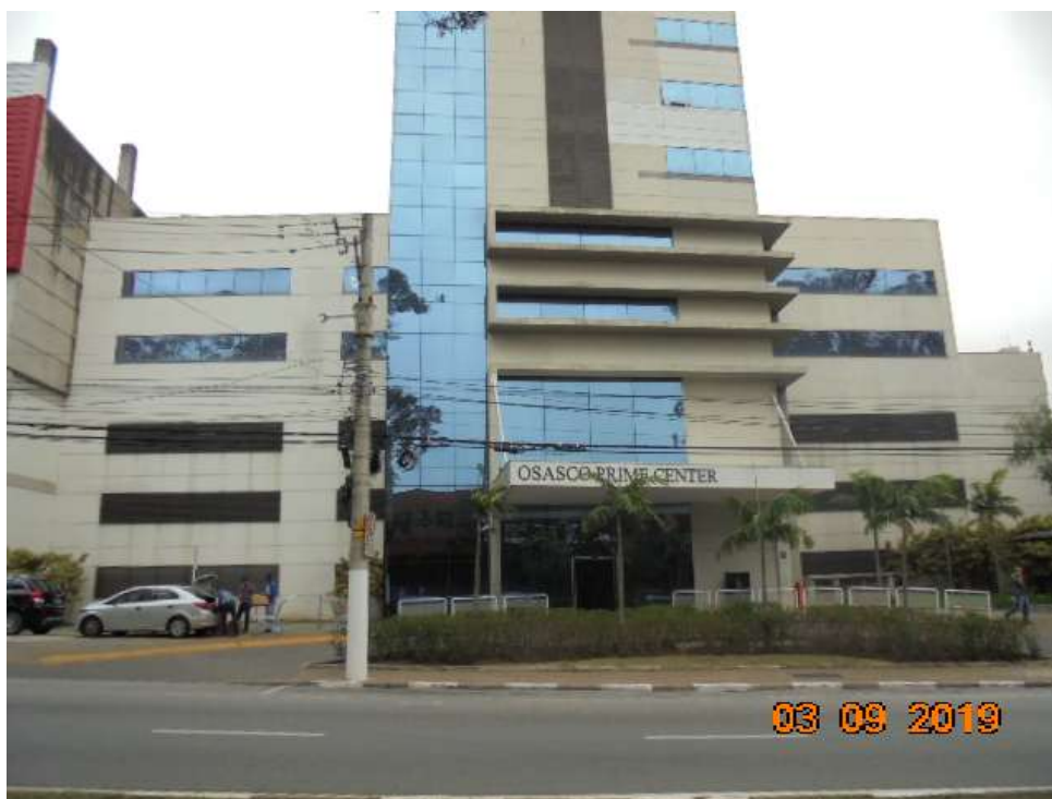
FOTO Nr.04: Detalhe da entrada do empreendimento pela Av. Franz Voegeli.