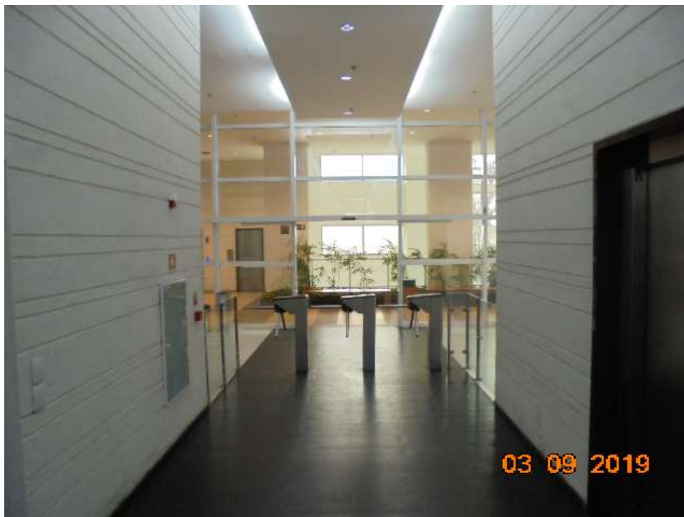
FOTO Nr.09: Vista interna da portaria do Ed. Santorini, situada no pavimento térreo.