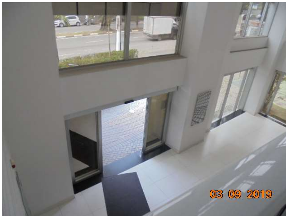
FOTO Nr.07: Vista do hall interno de entrada pela Av. Franz Voegeli.