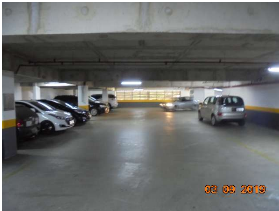
FOTO Nr.13: Vista de um dos pavimentos de estacionamento que servem ao Condomínio.