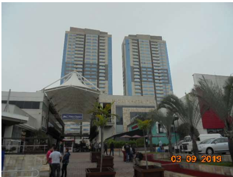
FOTO Nr.14: Vista dos dois edifícios do condomínio a partir da entrada do Shopping Open Mall.