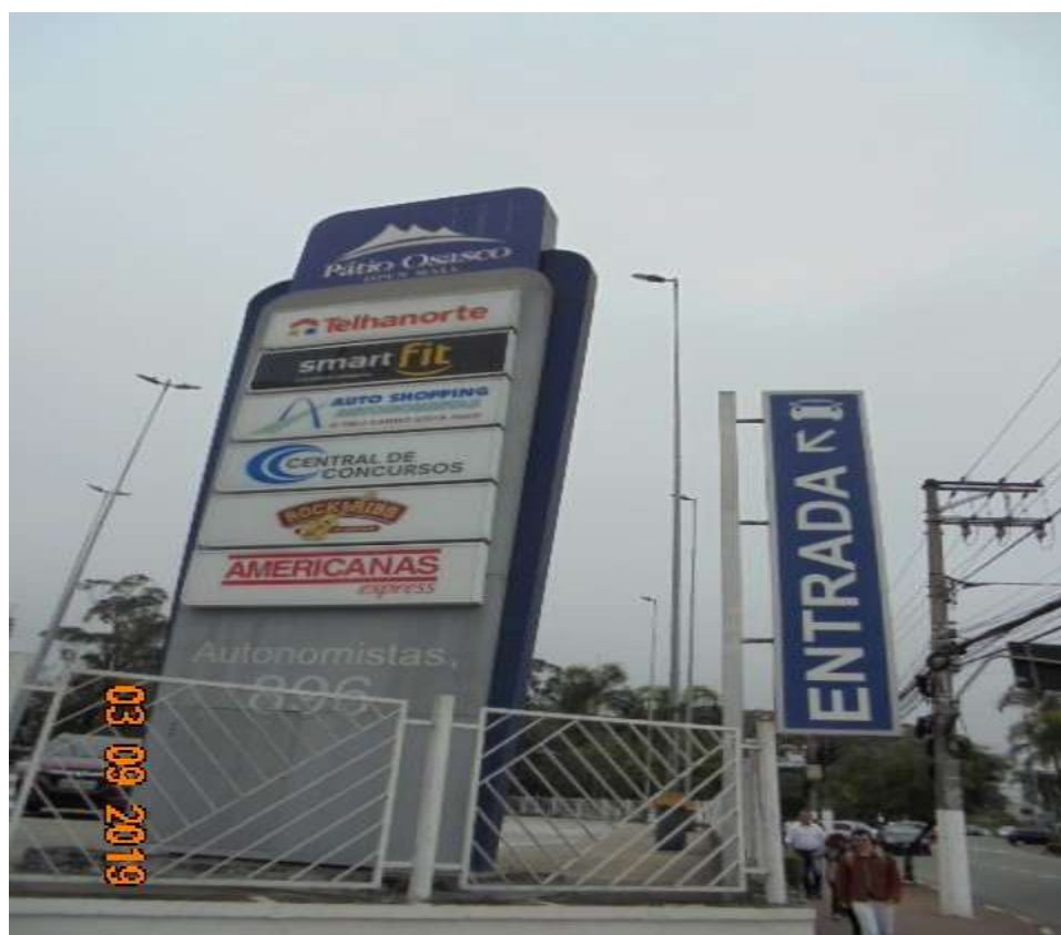
FOTO Nr.16: Vista de parte das lojas que compõem o Shopping Open Mall.