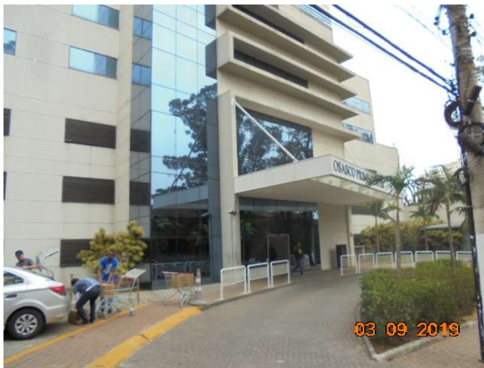
FOTO Nr.06: Detalhe da entrada do empreendimento pela Av. Franz Voegeli.