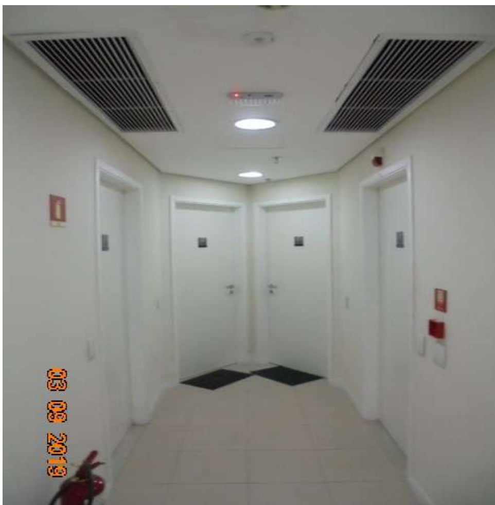
FOTO Nr.11: Detalhe do corredor de acesso com o escritório avaliando à direita.