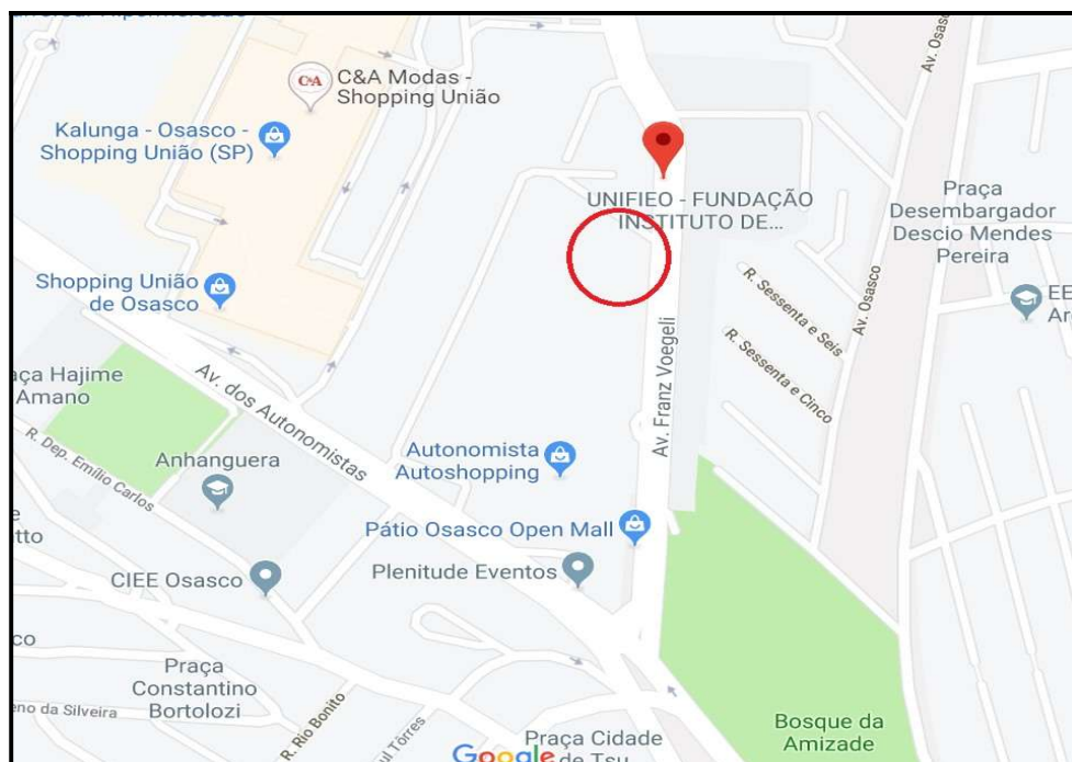
FIGURA Nr.02: Mapa de localização do imóvel avaliando, mostrando as vias de acesso e região circunvizinha.